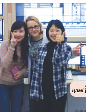
Разам з карэйскімі даследчыцамі ў лабараторыі сінхратрона PAL.

Было крыху нязвыкла штодня бацьчы, хай сабе і краем вока, людзей у вайсковай форме. Я пыталася ў карэйцаў, ці хочучы яны аб'яднання з Паўночнай Карэяй. Многія адказ-